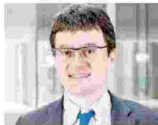
GUIDO ALFANI ORDINARIO DI STORIA ECONOMICA ALLA BOCCONI

denza che sale mano a mano che cresce il numero dei componenti della famiglia. È pari all'8,9% tra quelle composte da quattro persone e raggiunge il 19,6% tra quelle con quattro e più. La povertà, inoltre, aumenta in presenza di figli conviventi, soprattutto se minori, passando dal 9,7% delle famiglie con un figlio mi-