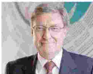
ENRICO GIOVANNINI EX MINISTRO DEL LAVORO PORTAVOCE ASVIS

Tra i cittadini stranieri l'incidenza della povertà assoluta tocca il 30,3% e corrisponde a oltre un milione e mezzo di persone, contro il 6,4% degli italiani (3,5 milioni di persone). I picchi più alti si registrano soprattutto al Sud e nelle aree metropolitane con l'inci-